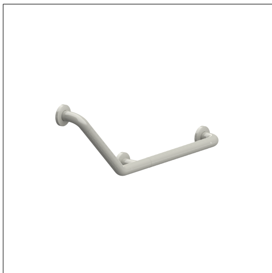
Image du produit